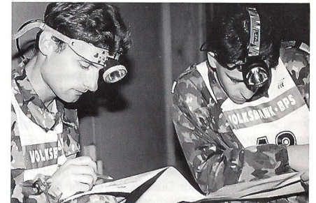
Intensives Kartenstudium und minutiöse taktische Absprachen vor dem Start als unabdingbare Voraussetzung für eine gute Leistung.