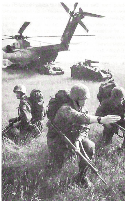
Aus Truppenpraxis/Wehrausbildung 12/95