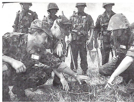
Ukrainische und amerikanische Soldaten untersuchen im Juli 1995 in der Ukraine während gemeinsamer Übungen für friedenserhaltende Massnahmen eine Landmine.

Die Ukraine unterstützt die Initiativen der NATO, mit denen die Bündnispartner insbesondere durch die NAKR-Mechanismen und das Programm der Partnerschaft für den Frieden (PPF) enger mit den Staaten Mittel- und Osteuropas sowie mit anderen Mitgliedstaaten der Organisation für Sicherheit und Zusammenarbeit in Europa (OSZE) verbunden werden sollen; sie sind ein anschauliches Beispiel für diesen Prozess des Wandels. Das Engagement für diese neue Partnerschaft ergibt sich nicht nur aus dem In-