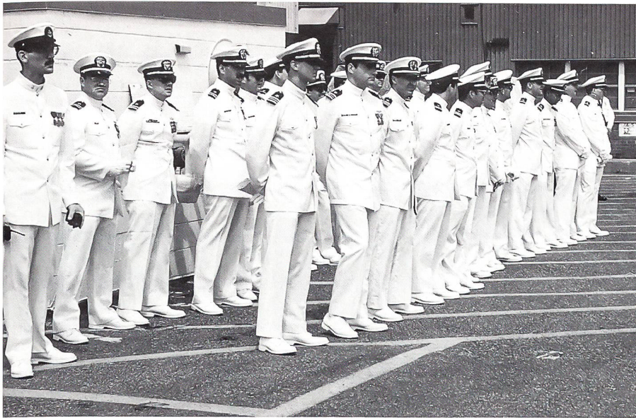
In den schmucken weissen Sommeruniformen warten die rund 30 Offiziere sowohl der «Gold»- wie der «Blue»-Crew der «USS Maine» auf dem Pier in Kittery, Maine, auf die Indienststellung ihres Bootes. Beim eigentlichen Festakt werden sie auf den Befehl «Crew, man the boat!» im Laufschrift auf das Boot eilen.