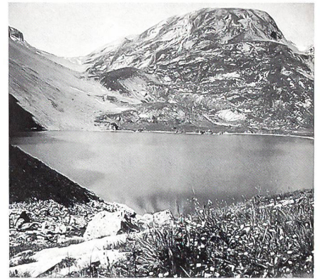
Am Iffigensee am 29. Juli 1943

rote Augen. Ich weiss genau, was ich zu tun habe, nur eben... Nach der Mittagsverpflegung nehme ich «das Herz in beide Hände», rufe die classe quatre zu mir und entschuldige mich bei ihnen. Wir schütteln uns die Hand und allen, besonders mir, ist es wieder wöhler! – Der Aufstieg führt über den Rücken vom Hohberg zum Sätteli, das wir um 9 Uhr erreichen. Oben am Iffigenhorn erspähen wir ein Rudel Gamsen. Für viele der bergungewohnten Samariterinnen ist es ein Ereignis. Inzwischen scheint uns die Sonne längst auf den Buckel, endlich dürfen wir den Waffenrock ausziehen. Unter uns liegt der See, welch' eine friedliche Stimmung! Bald lagern wir uns an seinem Ufer, 2065 m. Alles, was der Bergfrühling hervorzaubert, blüht: Soldanellen, Anemonen, Vergissmeinnicht, Alpenveilchen, Enzianen, eine Augenweide! Wir Fahrerinnen haben uns etwas abseits installiert. Bei uns und den Samariterinnen frage ich, wer noch nie ein Edelweiss gesehen habe. Es melden sich 5. Ich gehe mit ihnen zu dem vorher gesuchten Hang und ein jedes darf sich ein