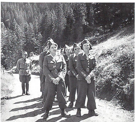
Bereit zum Abmarsch