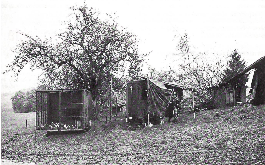
Zwei der sechs mobilen Brieftaubenschläge, deren beflügelte Bewohner einst von Soldaten und neu von Züchtern betreut werden. Die in diesen fahrbaren Schlägen untergebrachten Brieftauben sind ausschliesslich für die Zucht und für wissenschaftliche Studien reserviert. So erhofft man sich etwa neue Aufschlüsse über die Orientierungsfähigkeit der gurrenden Boten.

Zum ersten sind sie ausserordentlich zahm, robust und anpassungsfähig. Dies beruht auf einer versteckten züchterischen Selektion: Während vieler Jahre diente ein bestimmter Taubenstamm als Ausbildungsmaterial für Brieftaubensoldaten, und so wanderten alle Tiere ab, die – aus Brieftaubensicht gesehen – laienhafte Behandlung schlecht ertrugen. Übrig blieben Tauben, die sich rasch an wechselnde Bezugspersonen, tapsige Brieftaubensoldaten und permanente Störungen im Schlag gewöhnen. Solches Laientum findet man aber auch bei wissenschaftlichen