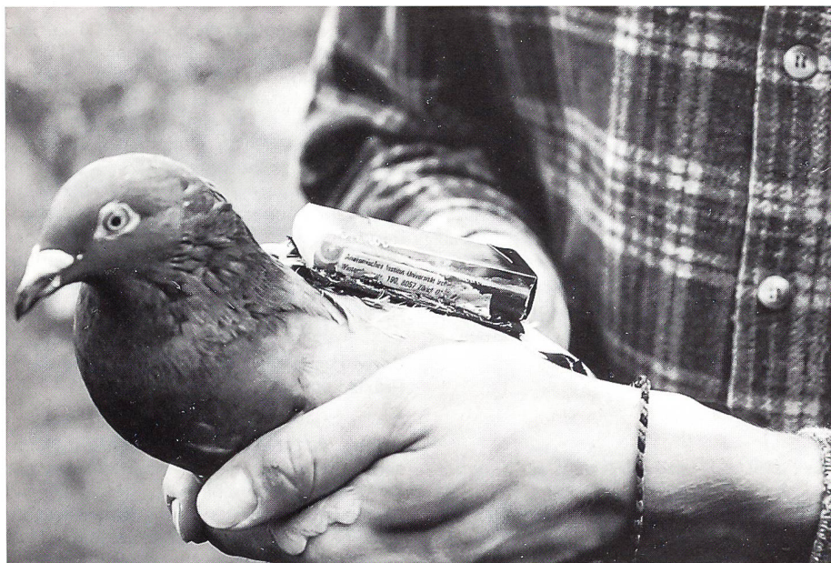
Eine Brieftaube mit aufgeschnalltem Recorder. Sozusagen ein Flugschreiber.