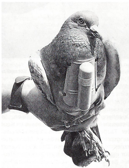
Armeebrieftauben sind aus zweierlei Gründen für die Wissenschaft von besonderem Interesse: Erstens sind sie sehr «pflegeleicht» und zweitens bilden sie eine hochspezialisierte Population mit besonderen Orientierungsfähigkeiten.