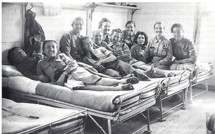
Frohmut im Kanti

Mittwoch, 11. August 1943: Erklärung des Bundesrates zum Fall «Hofmaier». De-facto-Anerkennung des französischen Befreiungskomitees durch England und USA. Nürnberg