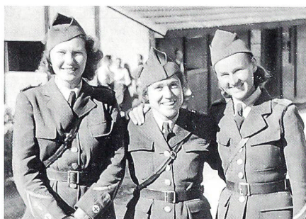
Drei gute Kameraden

Donnerstag, 19. August 1943: KEA Neuordnung der fleischlosen Tage im September. –