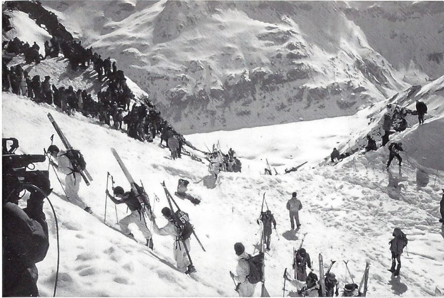
Von La Barma nach Rosablanche

pflanzt in einem sehr grossen Personenkreis, es mögen jeweils mit Begleitern und Zuschauern weit über 10 000 Menschen sein, den «Virus» des Skialpinismus.