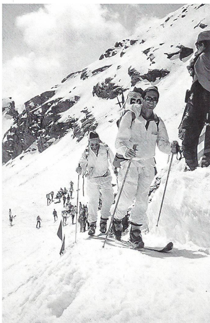
Im Aufstieg zum Col de la Chaux

«Regelmässige Bergtouren» für die Teilnehmerbedingung heisst nichts anderes als mit dem Berg vertraut zu sein. Damit ist auch die verlangte Vorsicht für jeden Patrouilleur um sein eigenes Tun und Lassen gegeben. Für die Sicherheit zeichnet die Organisation der Wettkampfleistung. Sie sorgt für die Anordnung aller vorsorglichen Massnahmen zur Durchführung des Wettkampfes. Sie sorgt für die Begehbarmachung von schwierigem und schwierigstem Gelände; sie beurteilt laufend die Wetterlage; sie hat zu evaluieren, zu entscheiden, und der Katalog der Aufgaben scheint endlos zu sein. Eines muss besonders hervorgehoben werden, was die Wettkampfleitung nicht vernachlässigt und was immer wieder gesagt werden muss: Die «Rennstrecke» ist in einem Hochgebirgsraum; sie wird nur für die Patrouille des Glaciers entsprechend begehbar gemacht: vor und nach dem Wettkampf ist dasselbe Gelände schwieriger, hochalpiner Raum.