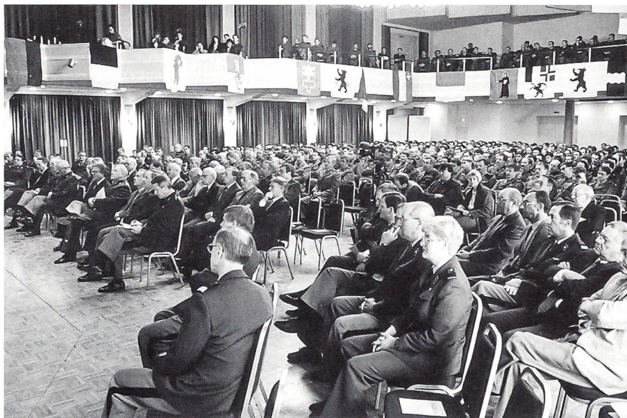
Das Kader der Luftwaffe und die Gäste versammelten sich im Leuchtersaal des Kursaals Bern.