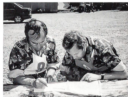
Ob die zwei Wettkämpfer wohl etwas Mühe mit der Postensuche haben?

1925 hatte der Unteroffiziersverein vom linken Seeufer Gelegenheit, an den Schweizerischen Unteroffizierstagen in Zug das Gelernte unter Beweis zu