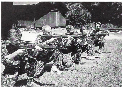
Die korrekte Kniendstellung muss zuerst trocken geübt werden.

Schon um 1843 sorgten sich tatkräftige Bürger um das Ansehen des Unteroffiziers. Sie gründeten einen «Östlich-schweizerischen Unteroffiziersverein», dem 9 Sektionen beitraten. Mit bescheidenen ausserdienstlichen Tätigkeiten wollte die junge Vereinigung die damals noch übliche, geringgeschätzte Stellung des Unteroffiziers (Uof) bei den Offizieren und Mannschaften gebührend aufwerten. Um dem Ausspruch des Generals Wille «Der Unteroffizier sei das Rückgrat der Armee» nachzuleben, organisierte der Verband ausgiebige Propaganda für die Ausbildung des Unteroffiziers im Privatleben. Mit der Durchführung von mehrstündigen Wettübungen an sogenannten Zentralfesten (1844, 1846 und 1847) wurde die gegenseitige Annäherung und Verbrüderung gepflegt. In den Wirren des Sonderbundkrie-