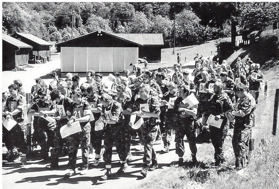
Vor dem Massenstart müssen noch die Uhren gerichtet werden.

40 Doppelpatrouillen aus den Unteroffiziersvereinen Lyss, Baselland, dem Feldweibelverband Sektion Zürich, dem Militärsanitätsverband und dem Unteroffiziersverband Zürich und Schaffhausen, absolvierten den perfekt geplanten 5-Disziplinen-Wett-