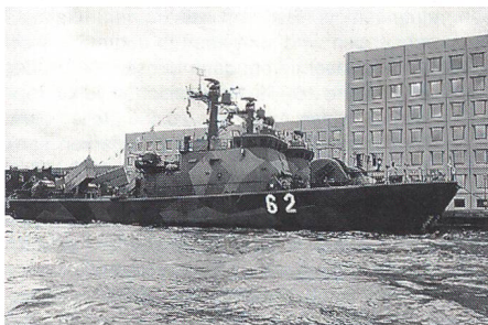
Die finnischen Schnellboote «Oulu» (62) und «Turku» (61) der «Helsinki»-Klasse

in Russland setzt China sein Bestreben fort, alte Schiffe durch qualitativ hochwertiges Material zu ersetzen. • Finnland • Auch die finnische Marine versieht seine Neuanschaffungen mit Stealth-Eigenschaften. Der Prototyp für eine Serie von bis zu acht