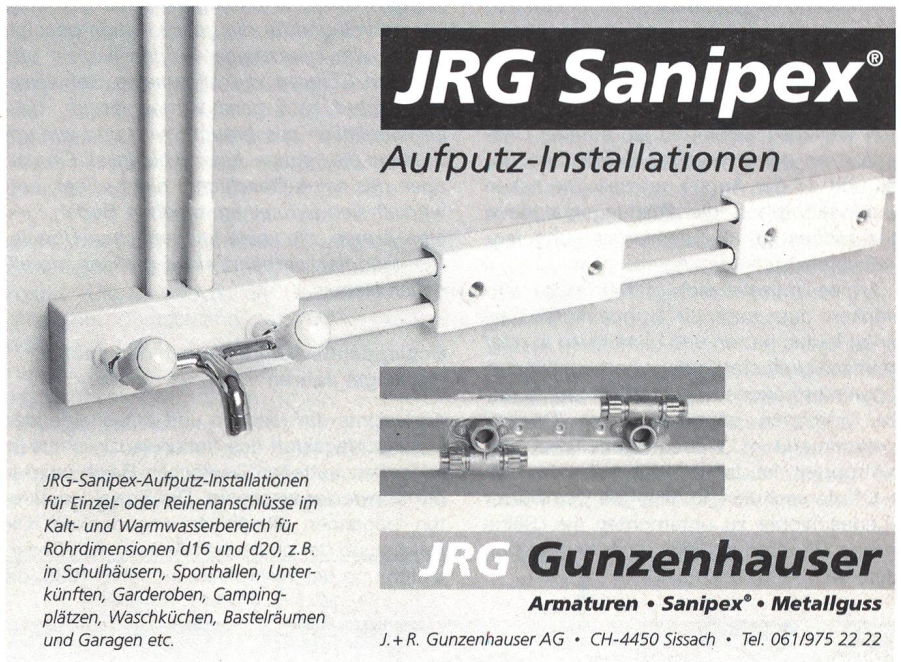
JRG-Sanipex-Aufputz-Installationen für Einzel- oder Reihenanschlüsse im Kalt- und Warmwasserbereich für Rohrdimensionen d16 und d20, z.B. in Schulhäusern, Sporthallen, Unterküften, Garderoben, Campingplätzen, Waschküchen, Bastelräumen und Garagen etc.

Bei Neuanlagen oder Sanierungen von Sporthallen, Unterküften, Garderoben, Campingplätzen, Waschküchen, Bastelräumen, Garagen etc. bieten JRG Sanipex Aufputz-Installationen dank ihren kombinierbaren Anschlussvarianten neue Möglichkeiten.