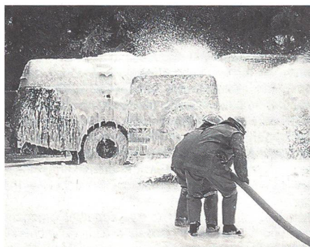
Gestellter Verkehrsunfall – ein Bundes-Feuerwehrgeschäft setzt ein.