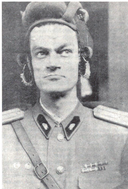
Oberst Pál Maléter (1917–1958) während des Volksaufstandes

Am 23. Oktober 1956 – durch diverse Zufälle und das Vorhandensein historischer Sternstunden – brach in Budapest eine Studentenrevolte aus. Sie erstreckte sich rasch auf das ganze Land. Die Staatsmacht hatte nur eine Antwort für die gerechten Forderungen der Demonstranten: der Staatssicherheitsdienst feuerte auf das Volk, worauf sich das Volk Waffen beschaffte und, da die ungarische Jugend in den vergangenen Jahren strenge paramilitärische Ausbildung erhielt, kam es zu einem