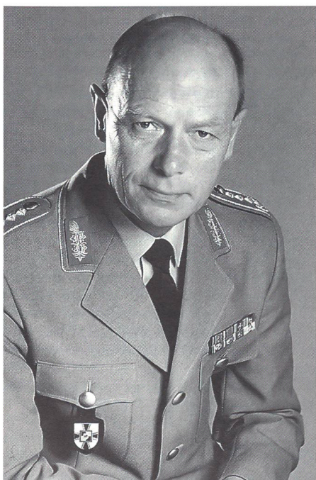
Der Generalinspekteur der Bundeswehr, General Hartmut Bagger.

Schon seit 1992 fördert die Bw Spitzensportler und -sportlerinnen auf insgesamt 704 Planstellen, von denen 664 Dienstposten dem Deutschen Sportbund (DSB) bzw. den Spitzenverbänden zur Förderung von Hochleistungssportlern mit Bundeskaderstatus bereitstehen. Sie können als Unteroffiziere und Mannschaften des Sanitätsdienstes eingestellt und auf Antrag in eine Sportfördergruppe der Bundeswehr übernommen werden. Bei den 26. Olympischen Sommerspielen 1996 in Atlanta, Ga, traten 92 Bundeswehrsoldaten, darunter acht Frauen, erfolgreich zu den Wettkämpfen an und bildeten ein