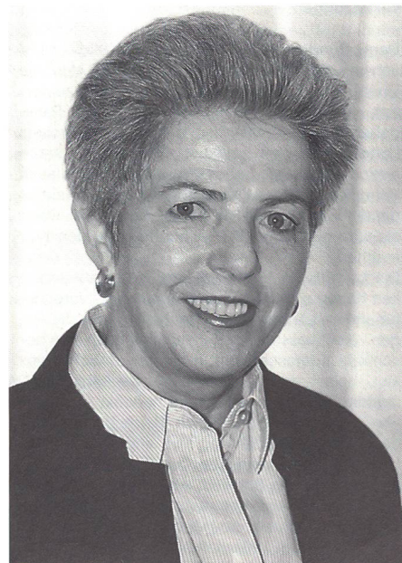
Die Wehrbeauftragte des Deutschen Bundestages, Claire Marienfeld.

über hinaus kann aus familiären Gründen bis zu drei Jahren Betreuungsurlaub – verlängert bis längstens zu 12 Jahren – unter Wegfall