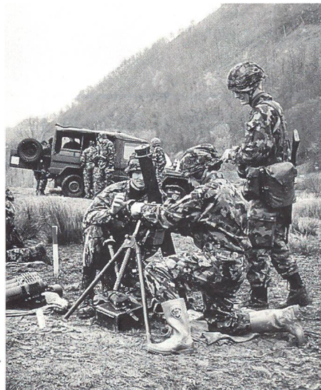
Übung macht den Meister. Praktische Ausbildung am Minenwerfer unter Aufsicht des Unteroffiziers.