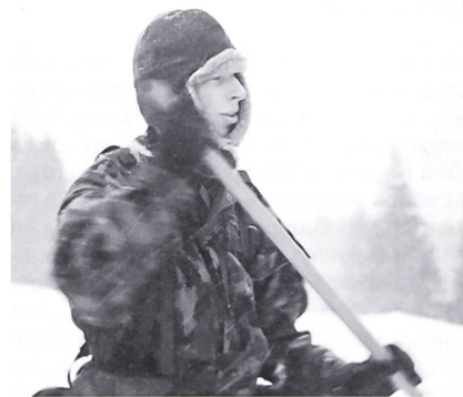
Rekrut am «fleissigen» Schaufeln.

Die Flab RS 245/98 war die erste Möglichkeit, in meinem jungen Leben auf Stufe Unteroffizier wirklich Leute auszubilden und zu führen. Zu den Höhepunkten zählte sicher die sechswöchige Ausbildungszeit in Emmen. Ich hatte den Auftrag, eine kleine Gruppe auf dem Feuerleitgerät 75/90 zu fachkompetenten Rekruten heranzuziehen. Dabei ging es vom einfachen Starten eines Aggregates über die Be-