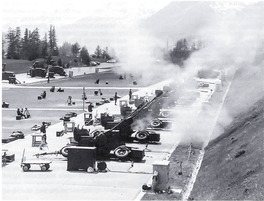
Flab Schiessplatz S-chanf: Scharfschussübung.

Die letzte Verschiebung führt die Schule ins Engadin, auf unseren Fliegerabwehr-Schiess-