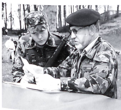
Adj Uof Pally im Gespräch mit Uem Kpl Aebersold.

Als wir das erste Mal an die Geschütze und Feuerleitgeräte traten, waren viele motiviert, denn damit war die infanteristische Grundausbildung grösstenteils vorbei. Alle waren