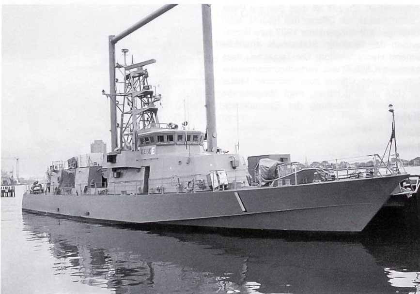
Die Navy setzt Special Forces in der Regel aus U-Booten (auch getaucht) ab. Sie verfügt aber auch über mit zwei 25-mm-Gatling-Kanonen und zwei Maschinengewehren bewaffnete Kampfboote der «Cyclone»-Klasse, die speziell zum Absetzen von Special Forces (SEALS) geeignet sind. Das Bild zeigt die «USS Cyclone» in Norfolk. Das Boot verfügt über eine spezielle Heckrampe zum Wassern eines ZODIAC-Schlauchbootes mit 8 SEALs.

Die immer wieder geheimnisumwitterten Special Forces lassen sich aus verständlichen