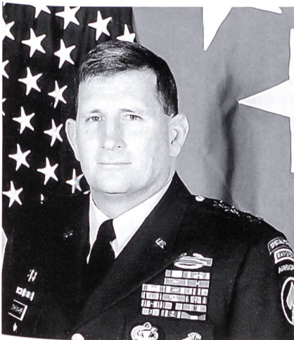
Der derzeitige Kommandant des Special Operations Command, der Viersterngeneral Peter J. Schoomaker, USA, Jahrgang 1946. Der Army-General hat sein Hauptquartier auf der MacDill AFB in Florida.

Das SOCOM setzt sich aus Kräften zur Spezialkriegführung (Special Operations Forces, SOF) des Heeres (US Army Special Operations Command, USASOC), der Luftwaffe (US Air Force Special Operations Command, AF-SOC) und der Marine (Navel Special Warfare Command, NAVSPECWARCOM) zusammen. Schliesslich gehört zum Kommando auch das sogenannte «Joint Special Operations Command» (JSOC) in Fort Bragg, Nordkarolina, welches aus einem Hauptquartier besteht, dem Aufgaben wie Ermittlung des Bedarfs nach Spezialkriegführungs-Einsätzen, nach entsprechenden Verfahren, Fragen der Interoperabilität, Standardisierung der Ausrüstungen, Planung und Durchführung von gemeinsamen Operationen von Elementen der verschiedenen Teilstreitkräfte (eben «Joint»), Übungsaktivitäten und die Entwicklung von taktischen Grundsätzen obliegen. Das US Marine Corps verfügt nicht über ein eigenes Special Operations-Kommando, hingegen