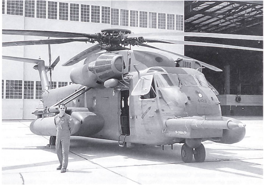
Ein Helikopter des Typs MH-53J «Pave Low III» der US Air Force auf dem Luftwaffenstützpunkt von Kirtland in New Mexico. Diese Maschinen sind zur Luftbetankung ausgerüstet und in der Lage, bei jedem Wetter und nachts Special Forces im Tiefflug und über grössere Distanzen zu infiltrieren bzw. zu exfiltrieren.

hat es in den letzten Jahren den auf amphibischen Einheiten dislozierten Marineinfanterieverbänden eine spezielle Ausbildung zur begrenzten Führung von solchen Einsätzen verordnet. So tragen beispielsweise die «Marine Expeditionary Units (MEU)» die Zusatzbezeichnung SOC für «Special Operations Capable».