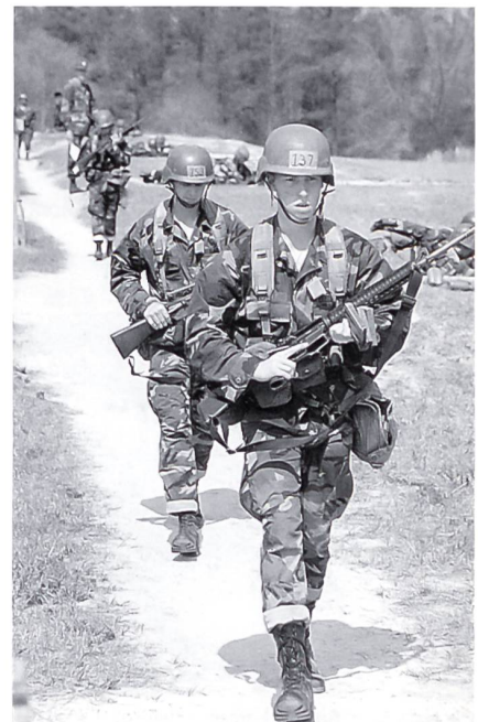
Die Ranger-Ausbildung des US-Heeres in Fort Benning, Georgia, ist eine gute Voraussetzung für Infanteristen und andere, später eine Special-Forces-Ausbildung zu erhalten.

Task Force zur Verfügung, die sich aus Angehörigen des Heeres, der Luftwaffe und der Marine zusammensetzt. Sämtliche in den USA stationierten aktiven Formationen und Reservekräfte der Special Operations Forces sind dem SOCOM unterstellt. Zu dieser er-