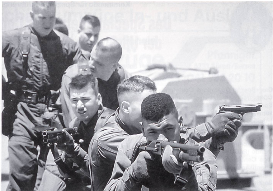
Angehörige des SEAL-Teams 8 von Little Creek, Virginia, ausgerüstet mit Spezialwaffen, anlässlich einer Einsatzübung während des Golfkrieges 1991.

● Counterproliferation. Dazu gehören alle Aktivitäten, um Verbreitung von Massenvernichtungswaffen zu bekämpfen. Dies kann selbst den Einsatz militärischer Kräfte zum Schutze von US-Interessen, die Beschaffung und Auswertung entsprechender Nachrichten