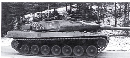
Leopard 2 A5

Im nächsten Waffenquiz werden moderne Kampfpanzer zu erkennen sein. Dazu gehören sicher die Typen M1 Abrams, Challenger, Leclerc, T72 und T80 sowie der Leopard 2. Besonders erwähnt sei der Leopard 2 A5. Diese kampfwertgesteigerte Version kommt dank ihrer Zusatzpanzerung in leicht anderer Aufmachung daher als gewohnt (siehe Bild).