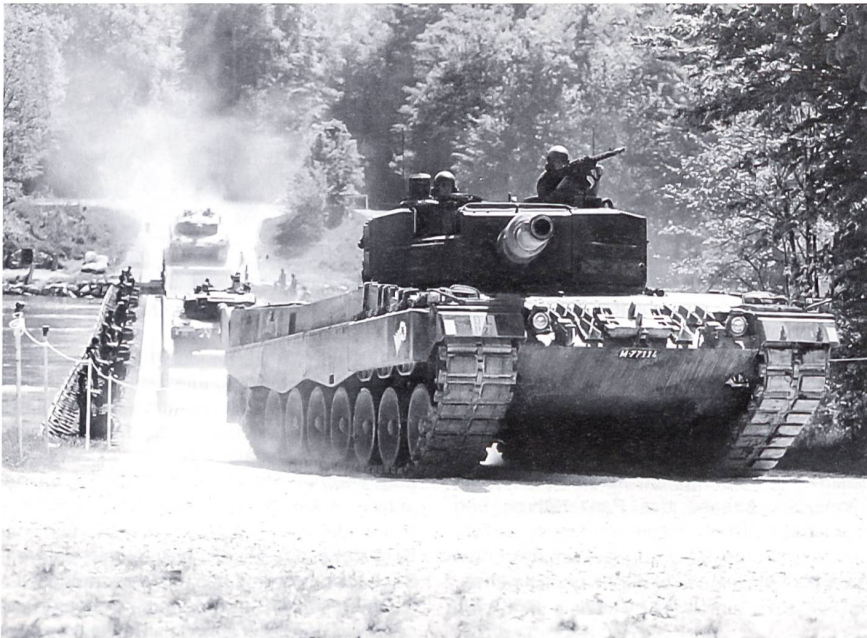
Nach Überqueren der erstellten Brücke.

det. Im Q-Gebäude mit all den Simulatoren wird das «Handling» des zukünftigen Arbeitsplatzes trainiert und im Zielhang mit 27-mm-Übungsmunition angewandt. Es ist eindrücklich, was man als Rekrut bei dieser Panzerkompanie in diesen ersten 10 Wochen alles erlernt. Eine Panzerbesatzung, bestehend aus drei Rekruten und einem Korporal, kann bereits situationsgerecht handeln und ist bereit, sich in den folgenden vier Wochen Verlegung zu behaupten. Kpl Buholzer