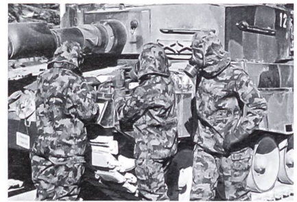
Reparaturarbeiten im C-Vollschutz.

verlegung, den Kompanieabend einmal ausgenommen. Das Beleuchtungselement durfte zum ersten Mal mit dem Lyran den Nachthimmel der Wichlenalp erhellen, während der Zug, welcher den Feuerkampf führte, einmal unter veränderten Bedingungen mit beschränkter Sicht agieren konnte, und der Rest hatte das Glück, das Schauspiel vom Beobachtungsturm her mit zu verfolgen. Es leuchtet ein, dass es an einem solchen Abend spät wird und jeder lieber ins Bett sinken würde als zu nächstlicher Stunde noch den Panzer zu «pedieren». Da kann es schon mal zu Unstimmigkeiten oder Reibereien kommen. Doch Probleme sind da, um gelöst zu werden, und man muss an ihnen auf gar keinen Fall zerbrechen, sondern kann daran wachsen. Damit möchte ich auf die gute Kameradschaft verweisen, die ich während meiner gesamten Dienstzeit erfahren durfte.