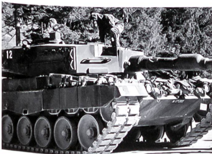
Emsige Bereitstellung unter erschwerten Bedingungen.

Inzwischen nehme ich die Funktion des Kp Kdt-Stellvertreters wahr, eine ebenso fordernde Aufgabe wie das Führen eines Zuges.