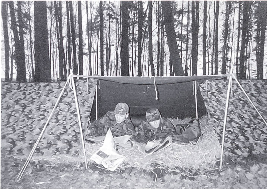
Im Zelt nach getaner Arbeit.

erschreckende Antwort: «Ja, er sei mit uns auf Jungfernfahrt». Zum Glück haben dies nicht alle Leidensgenossen gehört. Zur Beruhigung, es hat kein zweites Titanic-Unglück auf der Reuss gegeben. Nach drei Tagen war die Übung vorbei und wir so müde, dass wir sogar im Stehen einschliefen.