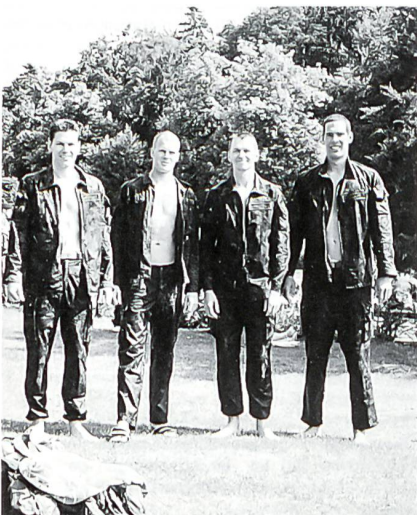
Man kann auch ohne plastifizierte Kampfanzüge ein gutes Resultat im Hindernisschwimmen erzielen.

So blieb das Team der Kompanie 17 in der Wertung am Ende des ersten Drittels stehen. Damit war klar, dass eine grosse Leistungssteigerung im Zielspringen Bedingung für ein ansprechendes Schlussresultat war.