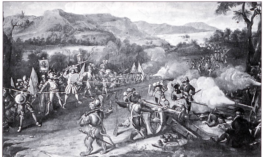
Allegorie auf die Villmerger Konfessionskriege. (Anfang 18. Jh.: Musée d'Art et d'Histoire, Genf)

Der Aufstand begann im Entlebuch und ergriff später das Mittelland und die Landschaft Basel. Während des Dreissigjährigen Krieges konnten die Bauern ihre Produkte zu hohen Preisen in die kriegsversehrten Gebiete nördlich des Rheins liefern. Bei Kriegsende stellte sich eine Absatzkrise ein. Die von den Kriegswirren heimgesuchten Ländereien wurden durch Einheimische neu beackert. Die Bauern