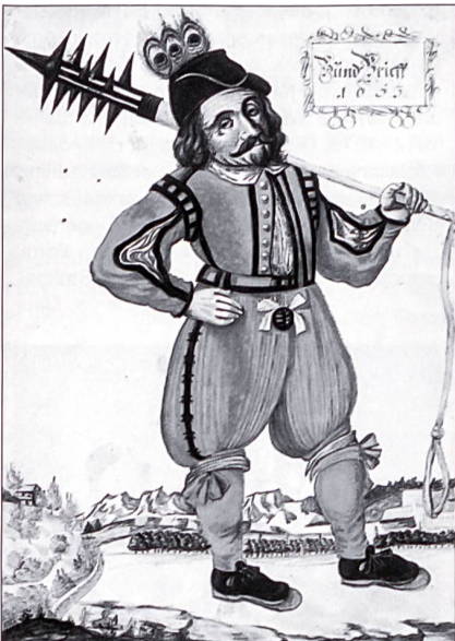
Niklaus Leuenberger war einer der Anführer im Bauernkrieg von 1653. Mit ihm zusammen wurden 34 Bauernführer hingerichtet – Opfer einer Obrigkeit, die in der ländlichen Bevölkerung nur Untertanen sah.

Basel konnte in der Folge widerstandslos in die Landschaft einmarschieren. 78 Rädelsführer wurden verhaftet und in Basel vor Gericht gestellt. Sechs Baselbieter erlitten den Tod durch das Schwert, einer durch den Strang. Das Urteil wurde vor dem Steinentor am 16. Juli 1653 vollzogen.