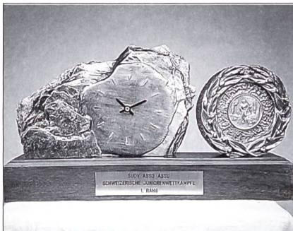
Der neue Gruppenwanderpreis, welcher von den Einheimischen aus Interlaken gewonnen wurde.