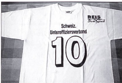
Das von der Ersparniskasse Interlaken gesponserte T-Shirt (herzlichen Dank) diente als Startnummer und durfte vom Junior als Souvenir nach Hause genommen werden.