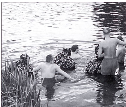
Jetzt zeigt es sich, ob das Schwimmpaket richtig erstellt wurde und somit wasserdicht ist.

mittels eines angebrannten Korkes, dem «Schminkköfferli» oder einer Kälteschutzmaske. Jetzt wird es ernst. Das Ganze durchnummeriert, die Nummer gemerkt geht es ab in die Fahrzeuge mit zugeklebten Fenstern zur Verhinderung der Orientierung. Am Einsatzort angekommen, wird einer nach dem andern den Nummern nach, alle 500 bis 1000 Meter alleine oder zu zweit im Wald ausgesetzt. Mit Hilfe der erhaltenen Karte und den Koordinaten des Treffpunktes gilt es, den Standort zu bestimmen und anschliessend durch das unbekannte Gebiet zu infiltrieren. Da wir uns in feindlichem Gebiet befinden, muss dies natürlich ohne Licht und ohne Kontakt zur Zivilbevölkerung geschehen.