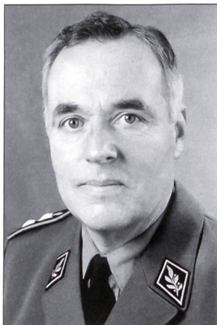
Divisionär, Kommandant Felddivision 2 seit dem 1. Januar 1992