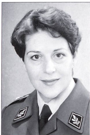
Brigadier, Chef Frauen in der Armee seit dem 1. Januar 1989

Unsere besten Wünsche mögen sie in die Zukunft begleiten.