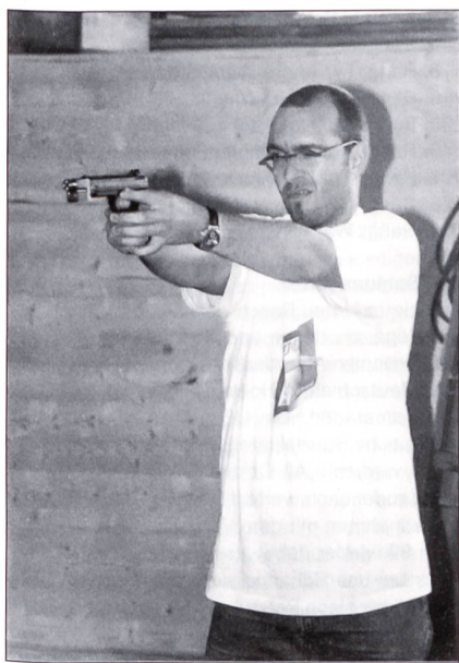
Volle Konzentration und ein gutes Auge werden vom Schützen beim Pistolenschiessen...