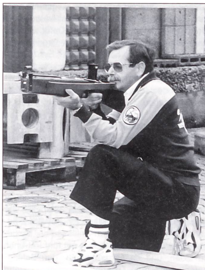
... und beim Armbrustschiessen verlangt.