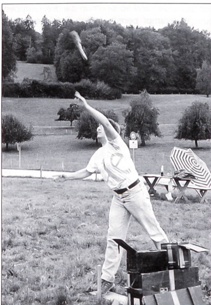
Ob wohl dieser perfekte HG-Wurf mitten im Ziel landen wird?

Wählbar aus sechs Disziplinen konnten der Ein-, Zwei- oder Dreikampf bestritten werden. Daneben wurden Gruppenwettkämpfe angeboten. Einzelne Sparten waren mehr auf Ausdauer