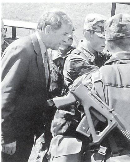
Bundesrat Adolf Ogi will es genau erklärt haben.

An der denkbaren Volksabstimmung vom 6. Juni 1993 verwarf das Schweizervolk die von der Gruppe «Schweiz ohne Armee» (GSoA) mit der Unterstützung der SPS lancierten Initiative «40 Waffenplätze sind genug – Umweltschutz auch beim Militär» und den Versuch, mit einem Volksbegehren den Kauf von 34 modernsten Kampfflugzeugen vom Typ F/A-18 zu verhindern. Der grosse Einsatz der von der militärischen Landesverteidigung und von einer glaubwürdigen Armee überzeugten Bürger und Institutionen war nicht umsonst. Geschlossen kämpften viele bei der «Arbeitsgemeinschaft für eine wirksame und friedenssichernde Milizarmee (AWM)» mit. Unvergesslich ist der Aufmarsch der 35 000 Schützen und der Angehörigen der militärischen und staatsbürgerlichen Verbände kurz vor der Abstimmung auf dem Bundesplatz von Bern. Auch unsere Zeitschrift «Schweizer Soldat» beteiligte sich mit Sonderauflagen und Manifesten am Abstimmungskampf. Die mit der Grussadresse der St. Galler Kantonsregierung zur Einweihungsfeier 1997 betraute Innen- und Militärdirektorin hatte eine nicht leichte Aufgabe. Die Sozialdemokratin Kathrin Hilber bekannte bei ihrer Rede freimütig, dass sie 1993 und noch nicht in der