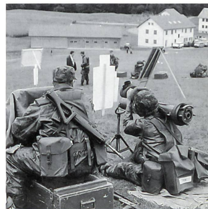
Ausbildung am Panzerabwehrenk Waffen-Schiesssimulator. Im Hintergrund Teil der Ortskampfanlage.