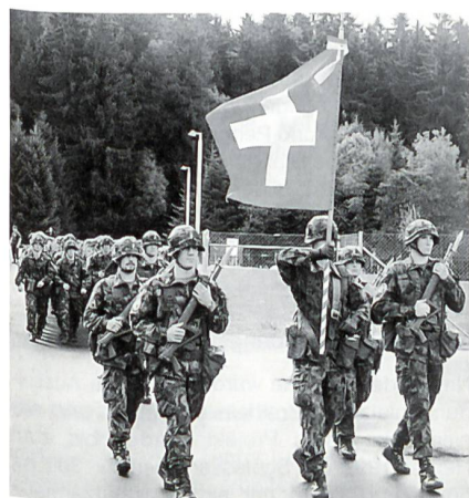
Einmarsch der Ehrenkompanie.

Die Ausbildungsinfrastruktur auf dem neuen Waffenplatz sei modern und trage den Ausbildungsbedürfnissen der Kampffüsiliere optimal Rechnung. Zum Erfolg tragen die Anlagen, Simulatoren, Monitoren und PCs bei. Entscheidend sei aber nach wie vor, dass die Ausbildungsführung und Methodik auch in