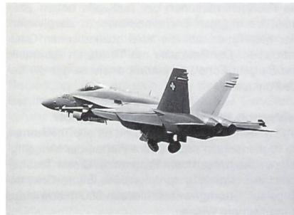
Erstmals war eine Patrouille mit dem neuen Kampfflugzeug F/A-18 an der AVIA-Meisterschaft mit dabei.