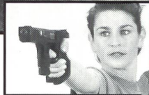
HÄMMERLI SP 20

Die neue Generation Sportpistolen im Kaliber .22 long rifle