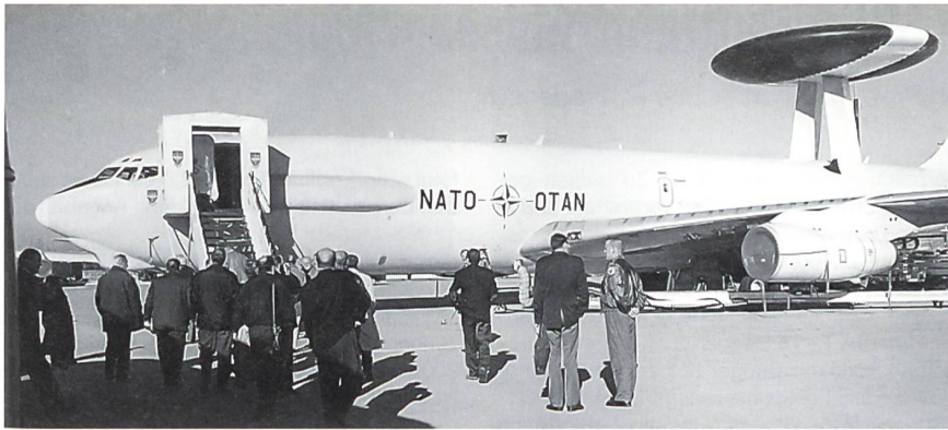
AWACS-Flugzeug des luftgestützten NATO-Frühwarn-Radarsystems.

hielten die EMPA-Besucher einen überzeugenden Eindruck einer multinationalen Zusammenarbeit. Der Platz ist die Haupteinheitsbasis der NATO-Frühwarnflotte, dem NATO-E-3A-Verband mit 18 Boeing-E-3A-Flugzeugen. Mit dem luftgestützten Frühwarn-Radarsystem (Airborne Early Warning [AEW]-Radar-System) wurde die Luftverteidigungsfähigkeit der NATO erheblich verbessert. Die AWACS-Flugzeuge haben internationale Besatzungen aus elf Nationen. So aus Belgien, Deutschland, Dänemark, Griechenland, Italien, Kanada, den Niederlanden, Norwegen, Portugal, der Türkei und den USA. Stellvertretend für viele andere Bereiche der Rüstung wurde uns die technische und logistische Zusammenarbeit bei der Entwicklung und Herstellung von Pionier- und Transportgeräten am Wasserplatz der Wehrtechnischen Dienststelle (WTD 51) erläutert und zum Teil vorgeführt.