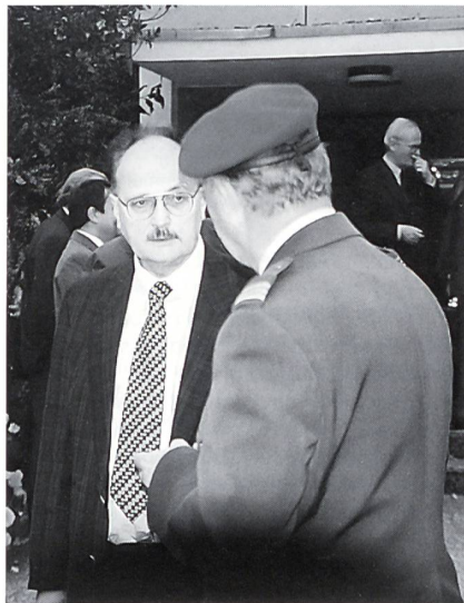
In angeregtem Gespräch... der Genossenschaftspräsident und sein Chefredaktor.

Die Abteikirche Maria Laach hiess ursprünglich Abbatia S. Mariae ad Lacum, Abtei der heiligen Maria am See, einfach «Laach» genannt und liegt in einer phantastisch schönen Landschaft. Das Laacher Seegebiet erhielt erst seine Bedeutung, als der Pfalzgraf Heinrich II. aus dem Hause Luxemburg-Gleiberg mit seiner Gemahlin Adelheid von Orlamünde im Jahre 1093 den Plan fasste, hier eine Benediktinerabtei ins Leben zu rufen. Viele ruhige und auch bewegte Jahre sind seither vergangen, im Jahre 1802 wurde das Kloster sogar aufgehoben als Folge der französischen Revolution. Erst seit 1892 leben wieder Benediktiner im Kloster, und heute sind es rund 70, die dort beten und arbeiten. In einem interessanten Film kann man sich den Klosteralltag anhand eines Tagesablaufes vorzeigen lassen. Bei unserem Besuch hatten wir im weiteren Gelegenheit, an einer Vesper teilzunehmen, ein eindrückliches Erlebnis, welches