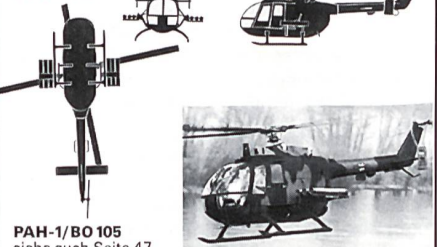
PAH-1/BO 105 siehe auch Seite 47