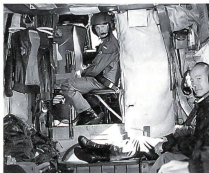
Blick in den Innenraum des Hubschraubers, Typ BO-105.

feindliche Armeen wurden zu einer Armee der Demokratie. Die Soldaten tragen die gleiche Uniform, ob sie aus Frankfurt am Main oder Frankfurt an der Oder kommen. Und es ist gut, dass der junge Mann aus Thüringen in Baden, der Wehrpflichtige aus Hessen seinen Dienst in Brandenburg verrichtet – ein Beitrag der Bundeswehr zur inneren Einheit unseres Volkes.»