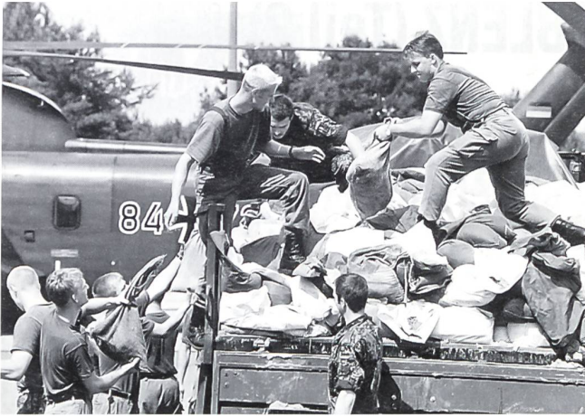
Hochwasser-Katastrophe Juni 1997. Soldaten verladen Sandsäcke zum Abtransport ins Überschwemmungsgebiet.