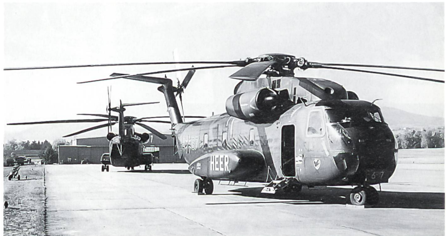
Die Militärredaktoren flogen mit dem Heeresfliegerregiment 35 nach Geilenkirchen.

Dazu der Gewerkschafter und ehemalige Verteidigungsminister Dr. Georg Leber: «Eine gesamtdeutsche Armee ist an der Stelle, wo die Kluft am grössten und die deutsche Teilung am tiefsten war, entstanden. Zwei ehemals