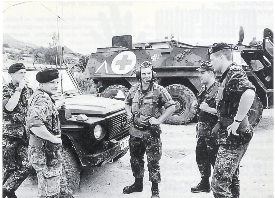
Patrouille des gepanzerten Einsatzverbandes der SFOR im Raum Kiseljah in Bosnien-Herzegowina bei einer kurzen Besprechung.

Mit PfP hat die NATO zugleich einen grundlegenden, aufregenden Schritt in eine neue Dimension der Sicherheit getan, nämlich vom Dialog hin zur praktischen Zusammenarbeit – wie jetzt im früheren Jugoslawien. «Partnership for Peace» ist nicht nur ein theoretisches Konzept, sie wird zunehmend als «Partnership for Peacekeeping» täglich gelebte Praxis. 13 PfP-Partner beteiligen sich zusam-