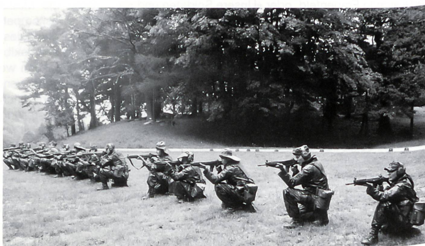
Das Kniend-Schiessen auf Distanz 30 m gehört zur «Neuen Gefechtsschiesstechnik».