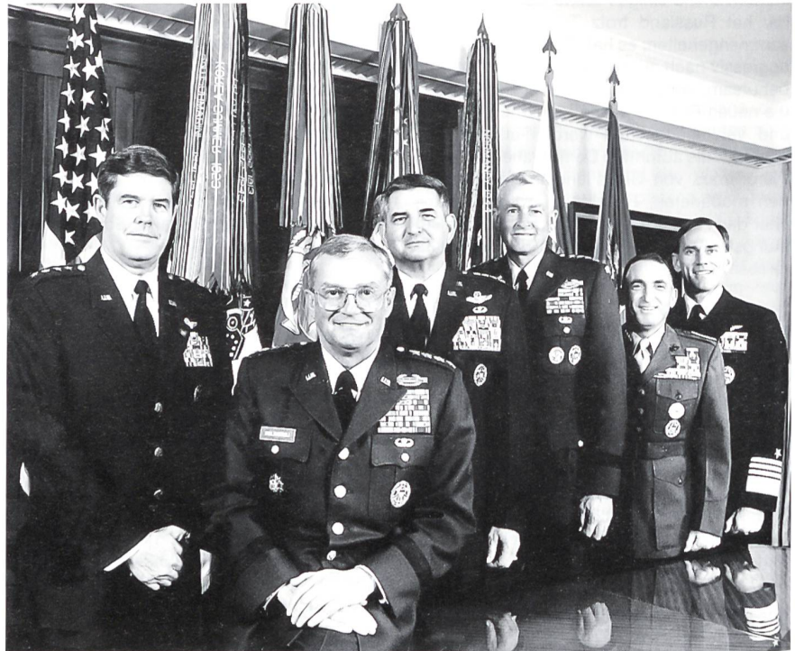
Derzeit sieht diese Spitze wie folgt aus: Der Vorsitzende der Vereinten Stabschefs (Chairman Joint Chiefs of Staff) ist General John M. Shalikashvili, US Army, sitzend; sein Stellvertreter oder Vice Chairman Joint Chiefs of Staff ist General Joseph W. Ralston, US Air Force, links; der Stabschef der Luftwaffe, General Ronald R. Fogleman, US Air Force, 3. von links; der Stabschef des Heeres ist General Dennis J. Reimer, US Army, 3. von rechts; der Kommandant des US Marine Corps ist General Charles C. Krulak, US Marine Corps, 2. von rechts, und der Chief of Naval Operations ist Admiral Jay L. Johnson, US Navy, rechts.

Dies ist mit ein Grund, weshalb in den vergangenen Monaten in den USA intensiv die Idee verfolgt wird, ein sogenanntes «Arsenal»-Schiff für das 21. Jahrhundert (SC-21 für «Surface Combatant» 21. Jahrhundert) als Feuerunterstützungsmittel zu bauen. Dieses soll u. a. mit einer extrem hohen Zahl von Marschflugkörpern bestückt werden. Andere Bezeichnungen für dieses Schiff sind etwa auch «Striker», «Strikeship» oder «Dreadnought». Dieses Schiff soll in gewissen Situationen sogar anstelle von Flugzeugträgern eingesetzt werden, zumindest dort, wo kein hoher Grad bezüglich Gefährdung zu erwarten ist und wo es ausschliesslich um den Einsatz von weitreichender «Artillerie» geht. Das maximal etwa 20 000 Tonnen verdrängende und rund 260 m lange Schiff soll besonders kostengünstig gebaut werden, nur eine Besatzung von etwa 50 bis 60, maximal 100