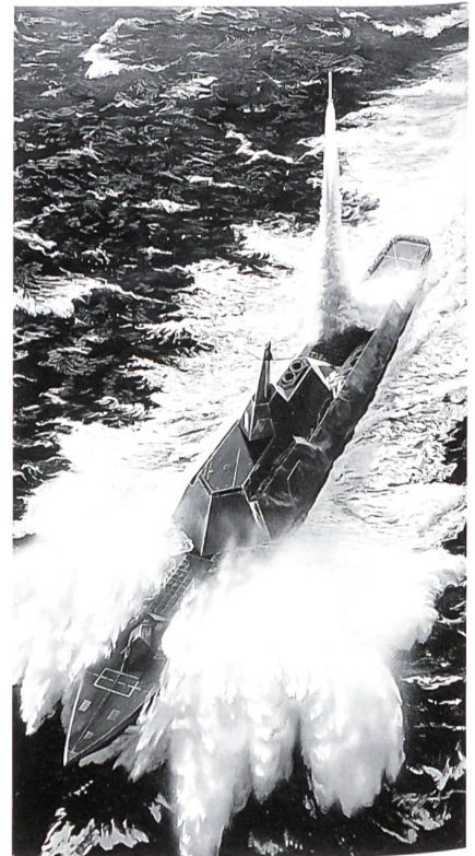
Das Bild zeigt einen Entwurf für ein «Arsenal»-Schiff der Firma Lockheed-Martin. Vor der Brücke mit den besonderen Konturen eines geringe Radarschatten erzeugenden Schiffes ist die besonders grosse Zahl von Startkanistern für die Marschflugkörper ersichtlich.