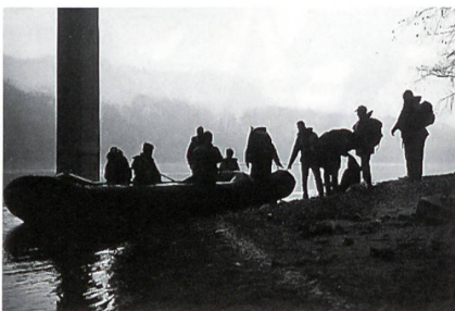
Stimmungsbild von der Übung «Beresina».

Das Detachement «Forelle» war am Treffpunkt eingetroffen. Der volle Rucksack liess erahnen, dass der Trupp bei der Beschaffung der Fische erfolgreich war. Sofort setzte das Boot über den Rhein, wo am andern Ufer bereits die Rauchfahne des Feuers aufstieg. Der Rastplatz war zu diesem Zeitpunkt bereits vorbildlich eingerichtet, und die Teilnehmer durften sich auf die bevorstehende Mahlzeit freuen. Einen kleinen Dämpfer erfuhren jedoch all jene Kameraden, welche sich auf eine fixfertig zubereitete Mahlzeit gefreut hatten, machte ihnen doch der Übungsleiter einen Strich durch die Rechnung. Kaum war der Rucksack mit den Fischen geöffnet, war augenblicklich klar, dass sich die Fische für die meisten Teilnehmer in einem ungewohnten Zustand befanden. Jeder der einen Fisch haben wollte (etwas anderes war nicht vorhanden), musste diesen selber ausnehmen und nach seinem Gusto entsprechend vorbereiten. Ein Gehilfe des Übungsleiters zeigte in der Folge, wie mit dem Messer einem Fisch zu Leibe gerückt wird und was beim Ausnehmen eines Fisches beachtet werden muss. Wenn auch mit etwelchem Widerwillen, beugte sich jeder Teilnehmer der ungewohnten Situation. Der «Überlebenstrieb» war offenbar doch grösser als die Abneigung, in die Eingeweide eines Fisches zu greifen und diesen mundgerecht vorzubereiten.