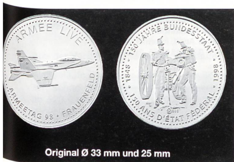
Original Ø 33 mm und 25 mm