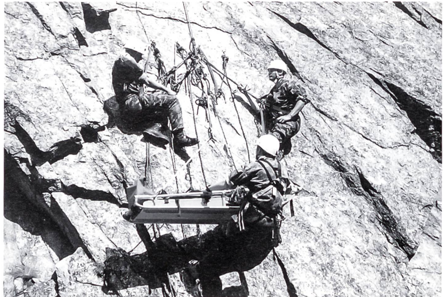
Rettung aus der Felswand.

Die Reform «Armee 95» hat die ZGKS stark aufgewertet, wurde sie doch für die Durchführung die Unteroffiziersschule und die