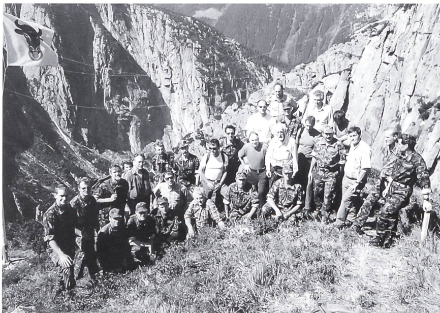
Die Teilnehmer der Erstbegehung der Via Ferrata «Diavolo» am 5.9.97

Begehung auf eigene Gefahr und Verantwortung!