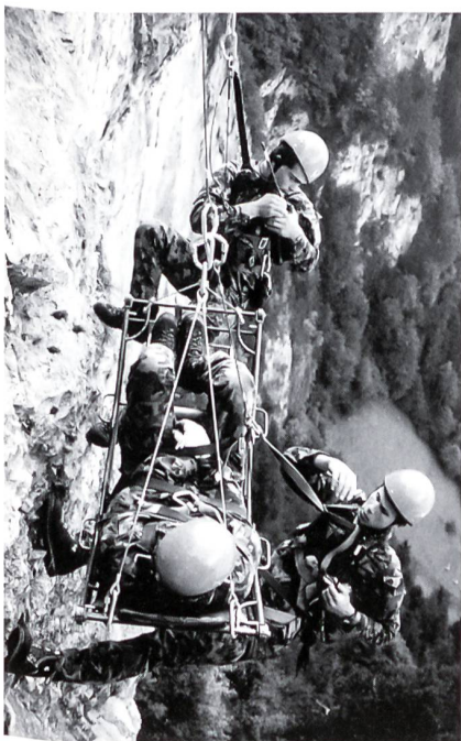
Retter, Helfer und «Verletzter» sind zum Aufseilen bereit.