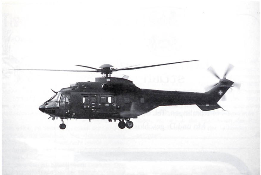
Der Transporthelikopter Super Puma.

Wer kennt sie nicht, die dunkelgrün bemalten, blechernen, dröhnenden Vögel, die immer öfters über die Landschaft brausen, unser Gehör strapazieren, aber doch irgendwo in unwegsamem Gelände auch wertvolle Hilfe bringen. «Die Luftwaffe führe pro Jahr rund 100 Transportflüge für Staatsoberhäupter,