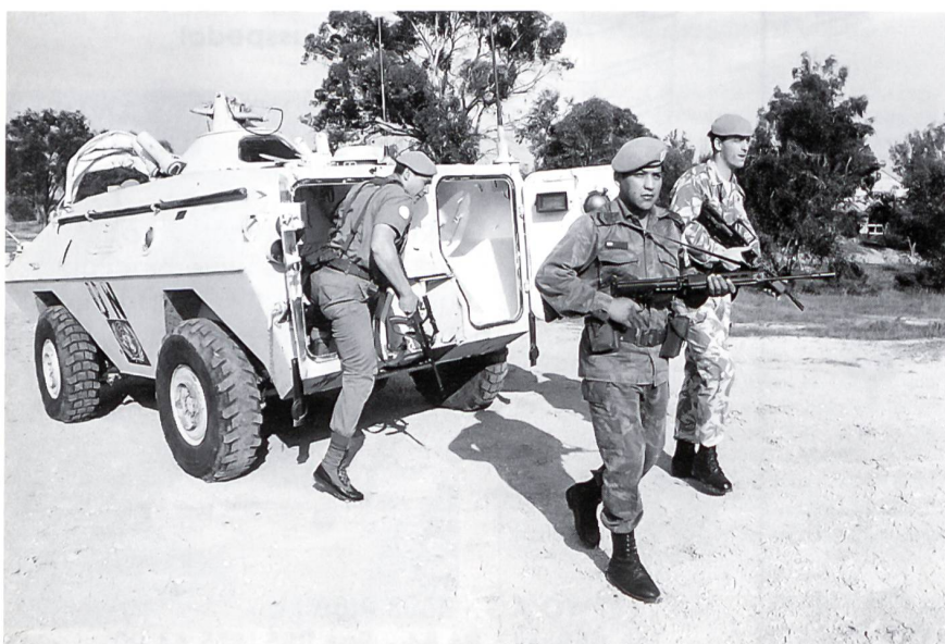
Angehörige der Force Reserve beim Absitzen vom gepanzerten Fahrzeug.