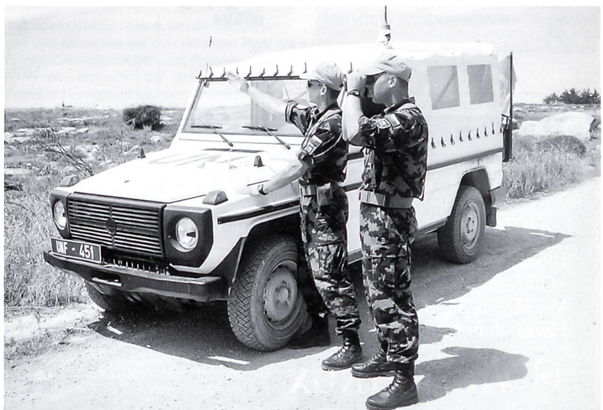
Eine mobile OP-Patrouille im Sektor 4 vom Slocon.

Das auf der britischen Basis Dhekelia befindliche Flugfeld wurde ausgebessert, und es landete bereits ein C-130 Hercules Transpor-