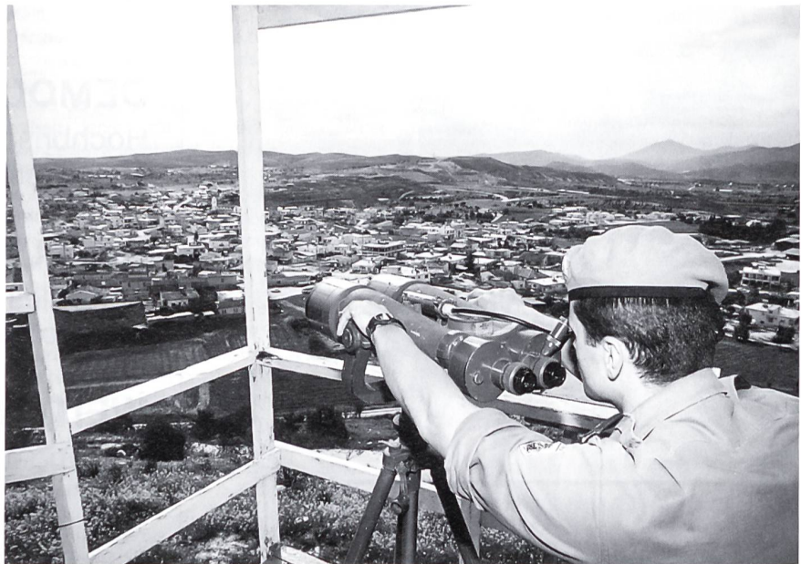
Österreichischer UN-Beobachter über dem Dorf Trouli im Sektor 4.

Am 20. Juli 1974 startete die Türkei, für alle Parteien völlig überraschend, eine selbsternannte «Friedensoperation» als Garantiemacht für Zypern und besetzte in der Folge einen Drittel der Insel. 165 000 griechische Zyprioten flohen in den Süden, eine der grössten Völkerwanderungen unseres Jahrhunderts.