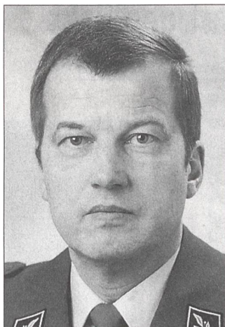
Brigadier, Kommandant Flugplatzbrigade 10 seit dem 1. Januar 1992.