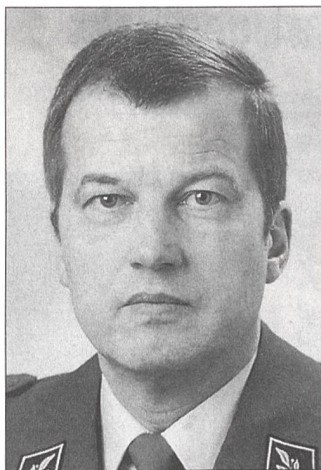
Brigadier, Kommandant Flugplatzbrigade 10 seit dem 1. Januar 1992.