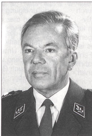
Korpskommandant, seit März 1992 Kommandant der Luftwaffe.