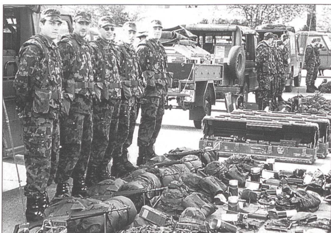
Eine «Stinger»-Feereinheit der Leichten Flablenkwaaffen Batterie II/16 bei der Inspektion des gesamten Materials.

10.45 Uhr, Flugzeug aus Süden meldet der Beobachter. Sofort richtet der Schütze – die