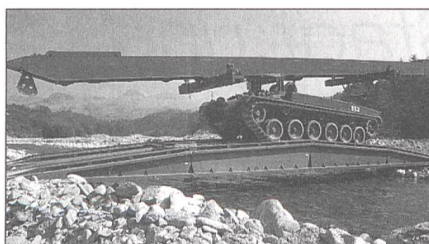
Der Brückenpanzer 68/88 (Brü Pz 68/88)

Aus diesem Grund werden den mechanisierten Verbänden Genietruppen unterstellt, welche mit Brücken- und Entminungsmitteln ausgerüstet sind. In unserer Armee stellen die Panzersappeurkompanien im Geniebataillon der Panzerbrigade die Bewegungsfreiheit sicher. Das Geniebataillon verfügt über eine Stabskompanie, eine Tech-Kompanie und drei Panzersappeurkompanien. In den Panzersappeurkompanien sind je zwei Brückenpanzer 68/88 eingeteilt, und dieses Fahrzeug möchte ich etwas genauer vorstellen.