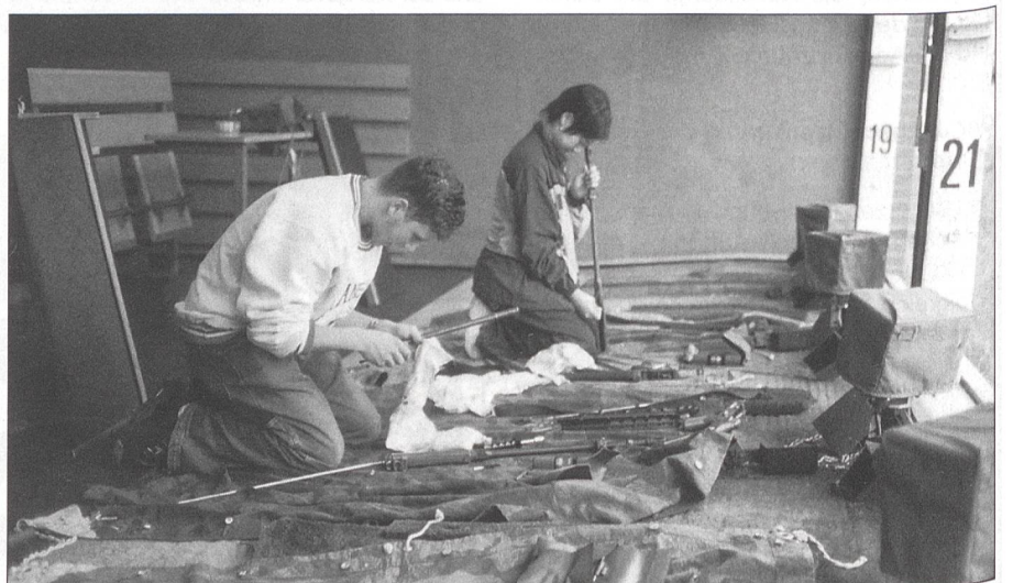
Nach dem Schiessen: Waffenzerlegung und Waffenreinigung wollen auch gelernt sein.

Unser Dank richtet sich an die Muttenser Leiter, aber gleichzeitig an alle andern, landauf und landab – was diese Leute leisten, ist gelebte und beispielhafte Jugendbetreuung und Jugendförderung! ☒