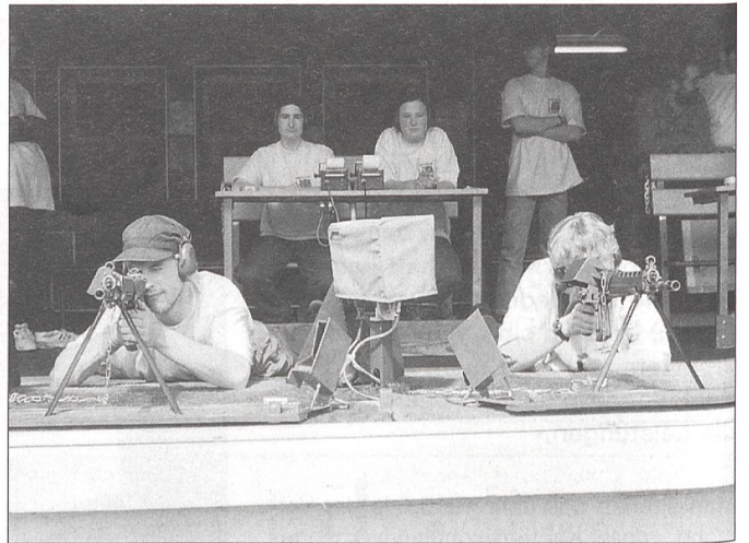
... und saubere Schussabgabe

Dieser Kurstag findet an einem Abend im Medienzimmer eines Schulhauses statt. Die übrigen Kurstage sind der Schiessfertigkeit gewidmet und werden in der örtlichen Schiessanlage durchgeführt. Das Feldschiessen, ein Nachwuchsförderungsschiessen und eine Wettkampfanstaltung des Stammvereins sind übrigens als Zusatzkurstage vorgemerkt.