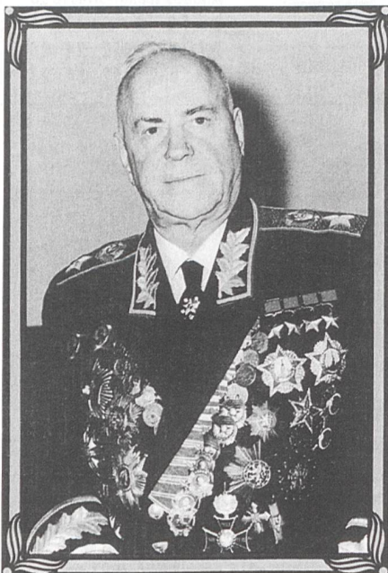
Marschall Shukow in Galauniform 1970, Moskau.

Im Jahr 1940 treffen wir Shukow als Chef des Kiewer Besonderen Militärbezirkes, in Anbetracht der damaligen politischen Lage ein besonderer neuralgischer Punkt der UdSSR. Die Rote Armee war gerade daran, sich mit Nazi-Deutschland für eine kriegerische Auseinandersetzung vorzubereiten. Das ganze Heerwesen musste neugestaltet werden. Überraschenderweise erhielt Shukow Anfang 1941 eine Spitzenposition. Er wurde zum Stellvertreter des Volkskommissars für Verteidigung und Chef des Generalstabes ernannt. Auf sei-