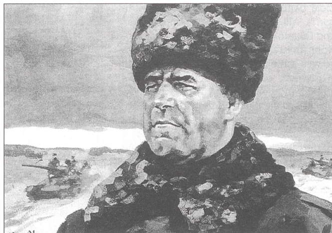
Marschall Shukow, 1941, Gemälde aus der Moskauer Zeitschrift «Rodina» 1996.

Rücksichtslosigkeit machten ihn bei den «Kameraden» unbeliebt.