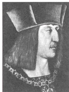
Kaiser Maximilian I. (1519)

hunderts nicht mehr ausreichen, um auf dem Schlachtfeld bestehen zu können. Mit der Abkehr vom Lehenswesen, dem Erstarken des Bürgertums, dem Entstehen eines freien Bauertums und mit dem Übergang zur Geldwirtschaft hat sich auch die Kriegführung gewandelt. Sie hat sich entfeudalisiert. Die Infanterie (v.a. die eidgenössische Infanterie) ist wichtig geworden. Sie greift an und sie kann siegen, was die militärische Bedeutung und das Ansehen des Adels (Kavallerie!) mindert. Gleichzeitig wird die Kriegführung durch die zunehmende Verbesserung und Verwendung des Schiesspulvers weiter verteuert. Die Arkebuse (Hakenbüchse) wird entwickelt, Kanonenrohre werden aus Eisen oder Bronze gegossen. Maximilian beginnt das Heerwesen zu reorganisieren und Landsknechte nach Schweizer Vorbild gegen Bezahlung anzuwerben. Ein deutscher Landsknechtsorden entsteht, eine Gesellschaft aus Knechten deutschen Landes, v.a. aus Schwaben, Bayern, Tirol sowie aus den Niederlanden und anfänglich auch aus der Eidgenossenschaft. Diese deutschen Landsknechte – unter ihnen der «Vater der Landsknechte», Georg von Frundsberg (1504 zum Ritter geschlagen) und Ritter Götz von Berlichingen – schlagen sich auf den Schlachtfeldern mit den eid-