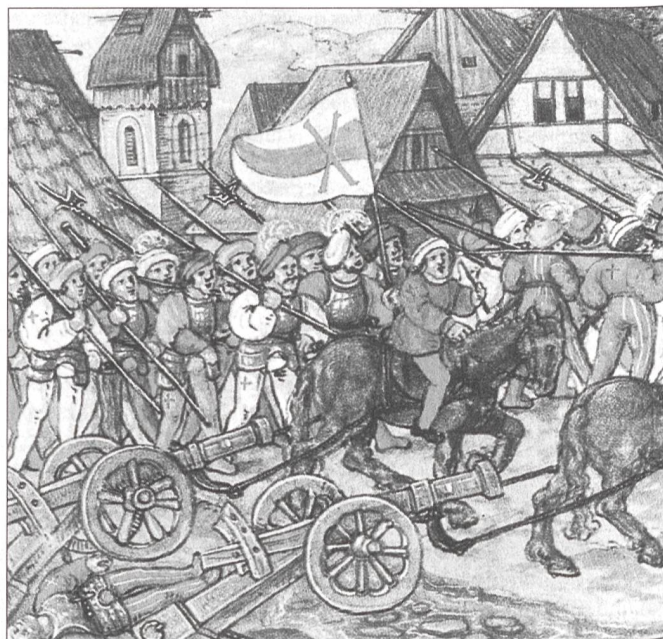
Schwäbische Bundes- truppen beim Abzug (Luzerner Chronik des D. Schilling, 1513; Zentralbibliothek Luzern)

1999 schwer nachvollziehbaren Masse. Selbstbewusst und mit einer gewissen Aggressivität betrachten die Eidgenossen den süddeutschen und elsässischen Grenzraum als ihren Einflussbereich. Verträge eidgenössischer Orte etwa mit Wangen im Allgäu, Buchhorn / Friedrichshafen, Rottweil und Orten im Elsass betonen diesen Einfluss.