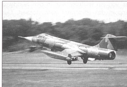
Aeritalia F-104ASA Starfighter der italienischen Luftwaffe