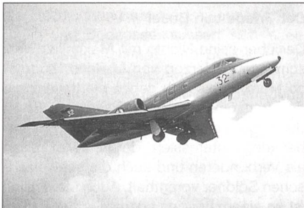
Dassault Falcon 10 MER der französischen Flotte