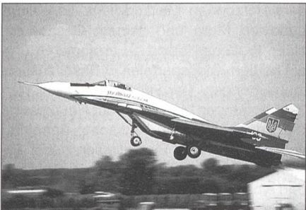
Mikoyan & Gurevich MiG-29 Fulcrum der ukrainischen Luftwaffe