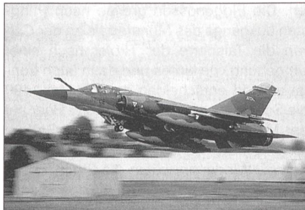
Dassault Mirage F1 der französischen Luftwaffe