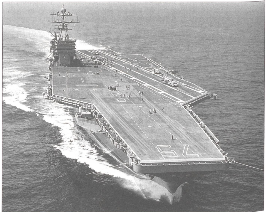
Der neueste Flugzeugträger der US Navy, die «USS Harry S. Truman», auf einer Versuchsfahrt vor der Küste von Virginia. Deutlich kommen die riesigen Ausmasse des über 330 m langen und 77 m breiten Flugdecks zum Ausdruck. Klar zu erkennen sind auch die zwei Katapultbahnen auf dem Vorderdeck und die schräg zur Schiffsachse verlaufende Landebahn. Hier sind zwei weitere Katapulte eingebaut.

Die «USS Harry S. Truman» ist der neunte nukleargetriebene Flugzeugträger der US Navy. Acht dieser Schiffe gehören der «Nimitz»-Klasse an. Ein weiterer Flugzeugträger, die «USS Ronald Reagan» (CVN-76), soll 2002 in Dienst gestellt werden, und für das letzte, noch namenlose Schiff dieser Klasse (CVN-77) sind die ersten Gelder bewilligt worden. Die «USS Harry S. Truman» wird voraussichtlich im Jahre