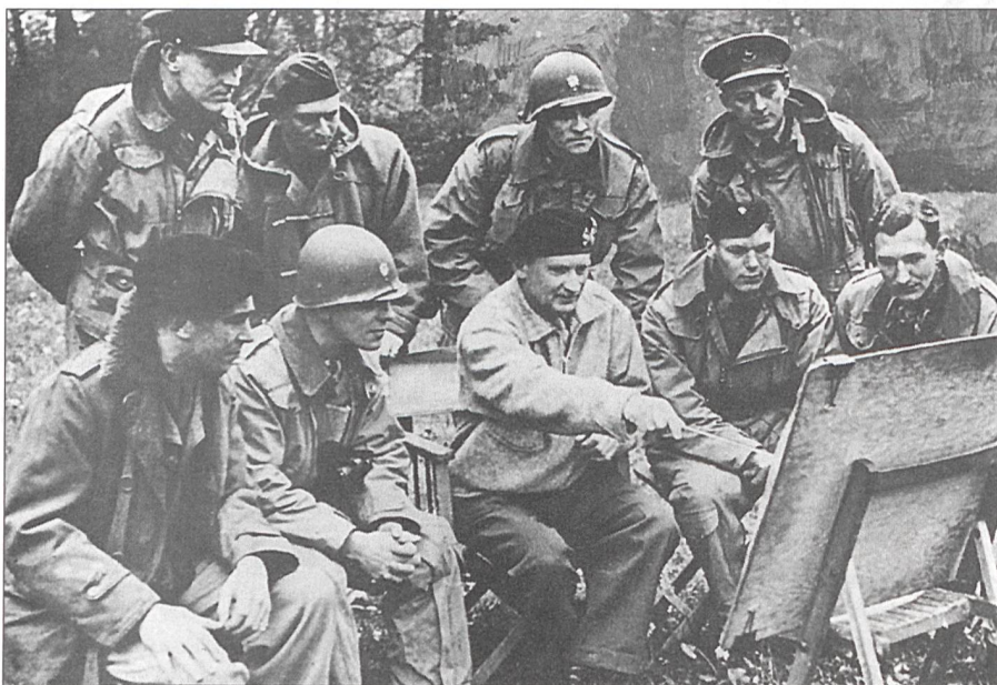
Montgomerys erste Pressekonferenz nach dem D-Tag.

Generalleutnant und Befehlshaber der 8. Armee Nahost-Streitkräfte, 23. 10. 1942