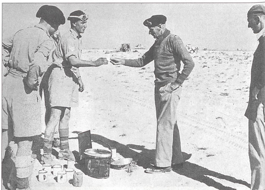
Schlacht bei El Alamein. Tee mit der Panzerwagenbesatzung.

Am 9. 9. 1940 startet Mussolini mit seiner in Libyen stehenden Armee von 14 Divisionen und 250 000 Mann unter Marschall Graziani einen Angriff auf Ägypten. Die Briten unter General Wavell mit 36 000 Mann in Ägypten und 27 000 Mann in Palästina treiben die Italiener durch die ganze Cyrenaika zurück. Über 70 000 Italiener fallen oder geraten in Gefangenschaft. Darauf greift Rommel ein und erobert die Cyrenaika zurück. Der Brite Auchinleck