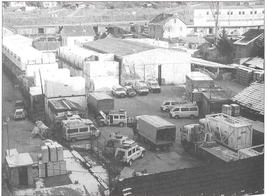
Swiss Camp Sarajevo

3. Medizinische Versorgung, 4. Sicherstellung der Postversorgung und 5. Unterhalt der Fahrzeugflotte. Nicht nur die Fahrzeuge der OSZE und unsere eigenen, sondern z. B. auch Fahrzeuge der Ombudsperson des Europarates, des Mine Action Centers (MAC) der UNO, des Internationalen Gerichtshofes (Kriegsverbrechertribunal) und Fahrzeuge verschiedenster schweizerischer Institutionen basieren auf der Swiss