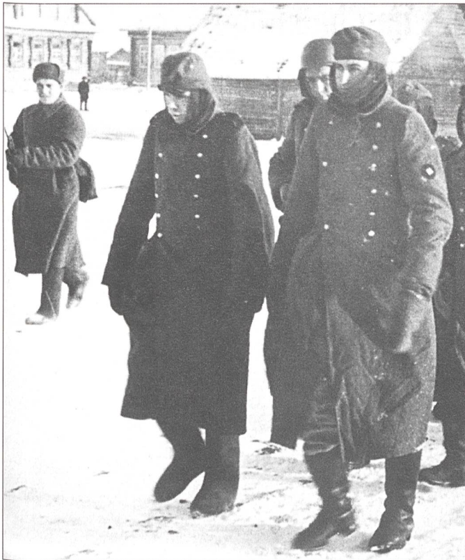
Januar 1943: Stalin-grad (heute Wolgograd) – die grösste militärische Niederlage der deutschen Wehrmacht im Zweiten Weltkrieg.

gangen, hätte er auf eigene Initiative Ende Dezember 1942 bedeutende Reste der 6. Armee retten können. Dann aber wäre seine Militärlaufbahn beendet gewesen. Manstein wagte jedoch nicht, gegen Hitlers Entscheid aufzutreten, als Folge: die 6. Armee ging Anfang Februar 1943 elend zugrunde.