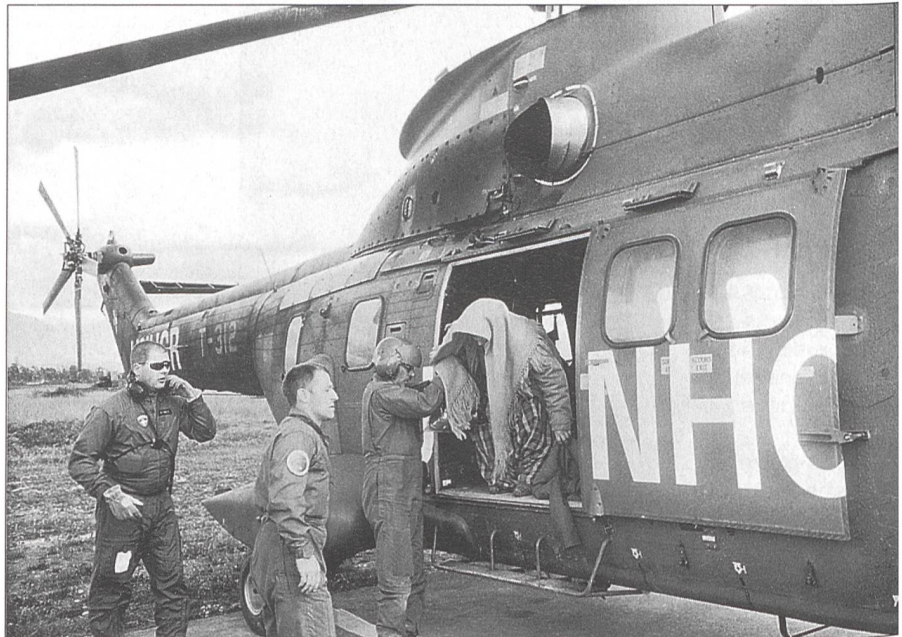
Rückkehr des Super-Puma-Helikopters T-312 aus dem Flüchtlingslager Kukes nach Rinas: Eine kranke Frau wird evakuiert.

Die albanischen Soldaten – ausgestattet mit schweren Filzmänteln, Kniestiefeln und den Mützen von 1918 – verschwinden fast. Sie lassen die Amerikaner gewähren, die