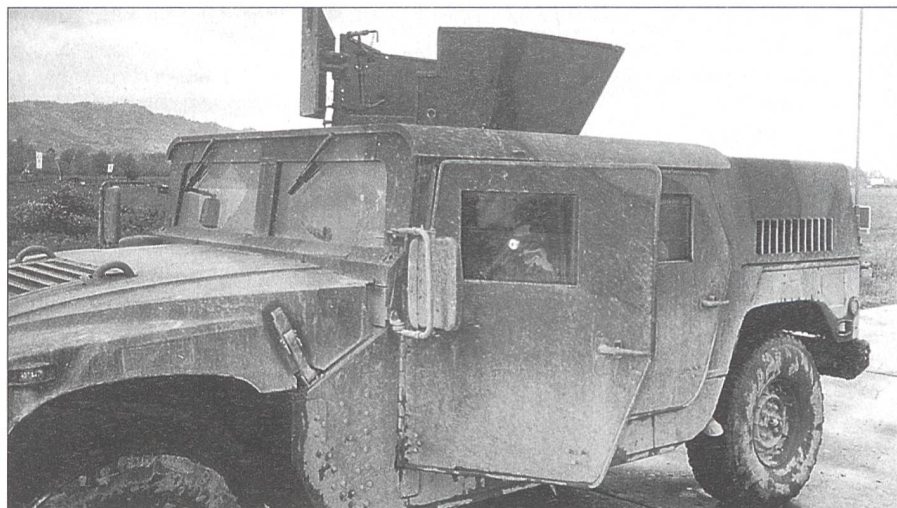
Ein Humvee der Amerikaner, welche den Flugplatz von Rinas seit Ausbruch des Kosovo-Krieges kontrollieren.

Zwölf Einsätze fliegt die Swiss Task Force am Tag. Mit den 25 Tonnen, die sie täglich transportieren kann, deckt sie einen Viertel der Tagesfracht – rund 100 Tonnen – ab. Die Schweizer Piloten starten oft auch bei schlechtem Wetter und gelten als überaus zuverlässig. «Das UNHCR sucht wei-