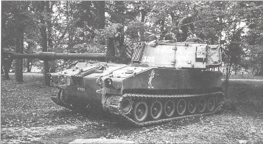
Eine M-109 Panzerhaubitze in ihrem Warteraum, der sogenannten Lauerstellung, in welcher die Fahrzeuge auf neue Schiesseinsätze in den Feuerstellungen warten. Es handelt sich bei diesem Fahrzeug um das «Cinque» der III. Btr.

santes und alles so kompliziert wie nur möglich. Das einzige, wofür man sich Zeit nimmt, sind die nicht weniger fragwürdigen Inspektionen durch höhere Instanzen. Man würde denken, dass das die wichtigsten Ereignisse im Leben seien. Auf jeden Fall bin ich froh, dass dieser Spass nur noch drei Wochen dauert.