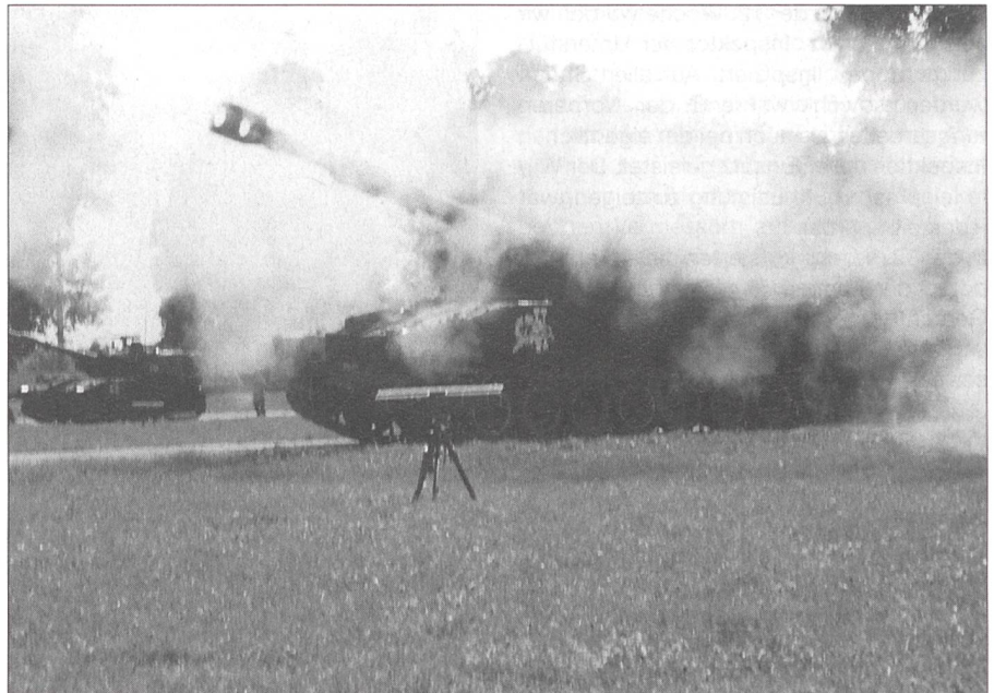
Eine M-109 Panzerhaubitze, aufgenommen zum Zeitpunkt des Abschusses. Es handelt sich hierbei um das Fahrzeug «Sexi» der II. Btrr. Im Vordergrund das Prisma, welches zum Einrichten und Festlegen gebraucht wird.

Als zweiter Kommandant übernahm ich in der sechsten Woche die Btrr III der Art RS